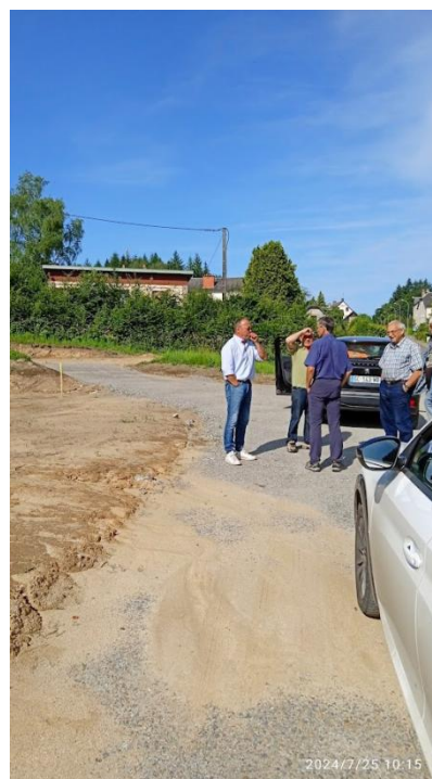
Terrassement logements intergénérationnels