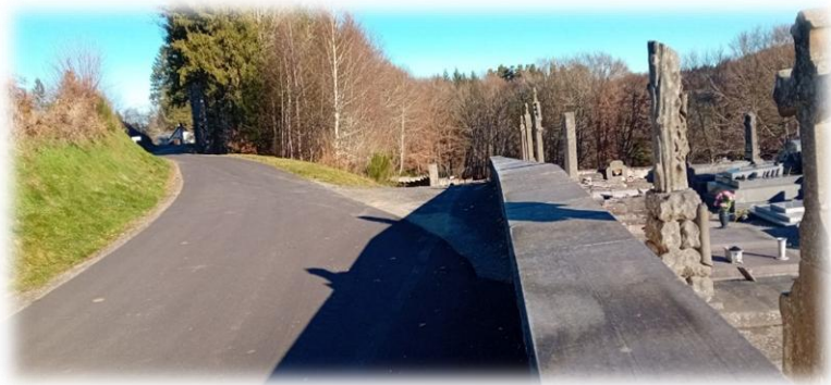
Route du cimetière